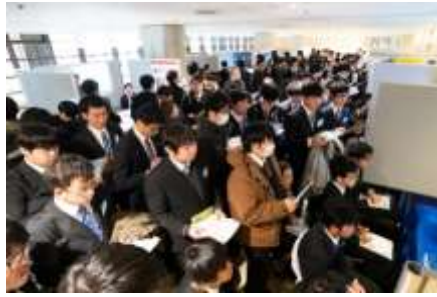
ブースでの個別説明