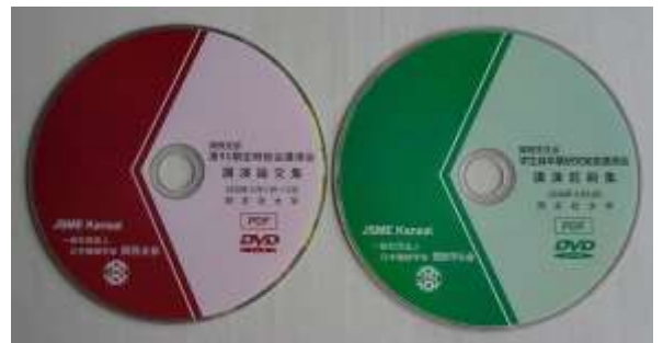
発行された講演論文集DVD

関西支部最大の行事である定時総会講演会（特別講演・学術講演・懇親会）・関西学生会学生員卒業研究発表講演会（特別講演・講演会・懇親会）を当初2020年3月10～12日に同志社大学京田辺キャンパス（京都府京田辺市）で開催する予定でしたが、新型コロナウイルス感染拡大防止のため、残念ながら現地での開催を中止いたしました。定時総会のみ3月11日に大阪科学技術センターで実施いたしました。第95期目の定時総会・講演会では297名の事前参加登録のもと、218件の講演申し込みがありました。講演を申し込まれた方については講演論文集DVDの発刊をもって既発表とさせていただきます。メカボケーション学生研究発表セッションは、対面形式での実施はできなくなりましたが、ポスターのデーターを元に優秀ポスター賞が選出されることになりました。57件の発表予定者のうち31名からポスターデーターの提出があり、それを元に支部幹事会で選考を行い、3名の方に同賞が授賞されました。また、関西学生会卒研発表講演会では、今回529名の事前参加登録があり、講演申し込みのあった354件につきましては講演論文集DVDの発刊をもって既発表とさせていただきます。