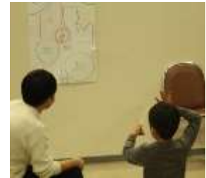
割りばしパチンコ