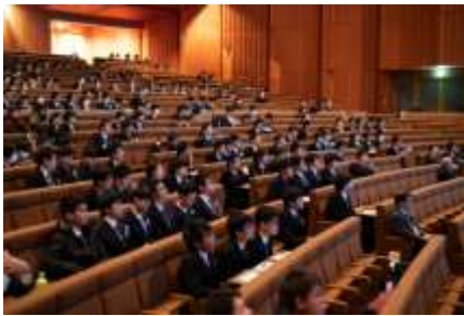
プレゼンテーション会場